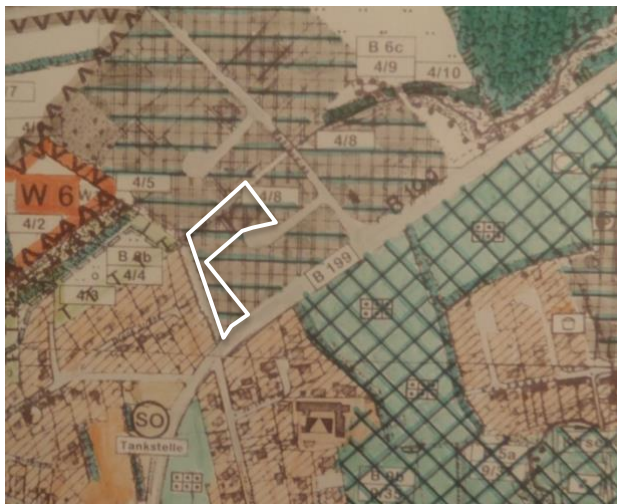
Abbildung 4: Ausschnitt aus dem Landschaftsplan 1999 der Stadt Kappeln

Der Landschaftsplan 1999 der Stadt Kappeln stellt den Geltungsbereich der 9. Änderung des Bebauungsplanes Nr. 16 als Handels- und Gewerbefläche dar. Angrenzend an das Plangebiet verläuft ein Bachverlauf, der in bestimmten Abschnitten als geschütztes Biotop nach § 15a LNatSchG mit dem vom Stand 3/98 geführt wird. Entlang des Bereichs, der an das Plangebiet angrenzt, wird der Bachlauf jedoch nicht wie in anderen Teilbereichen als Tümpel oder andere stehende Kleingewässer gelistet.